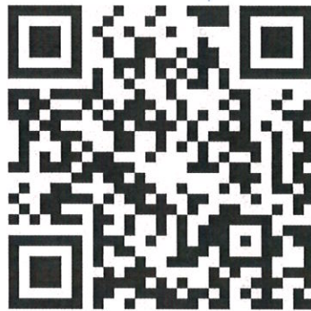
“开票信息采集”二维码

4、汇款成功后，请扫描下方二维码“开票信息采集”二维码进行开票信息登记，并上传付款凭证。培训结束后协会统一邮寄发票。