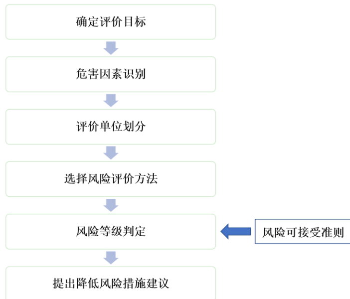
图 2 公共管廊风险评价流程图